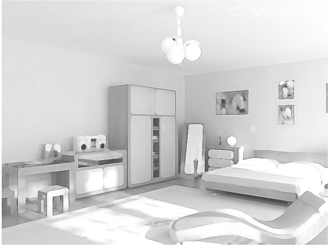
Figura 1 – Desenho de um quarto